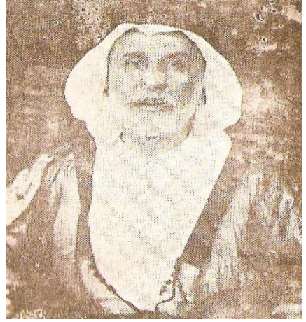
الشيخ زبيب المزبان رئيس عشيرة بني لام ونائب العمارة